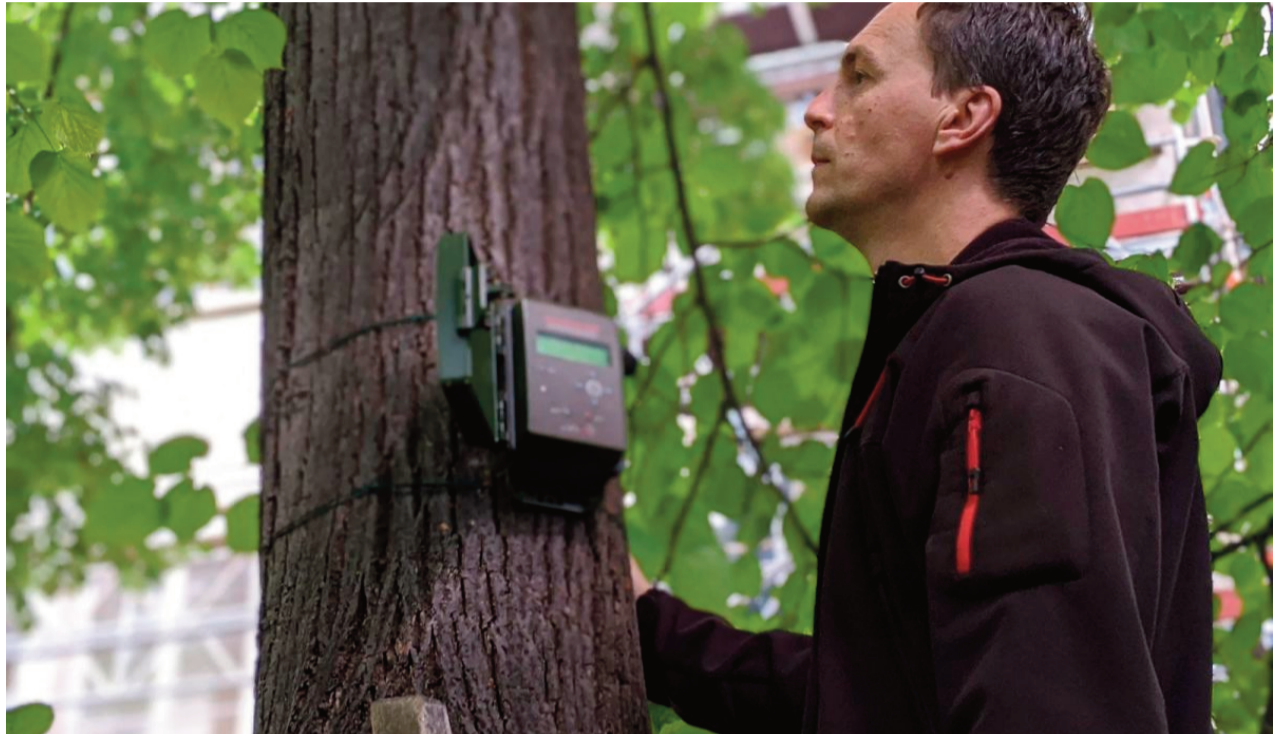
La végétation urbaine pour diminuer le bruit